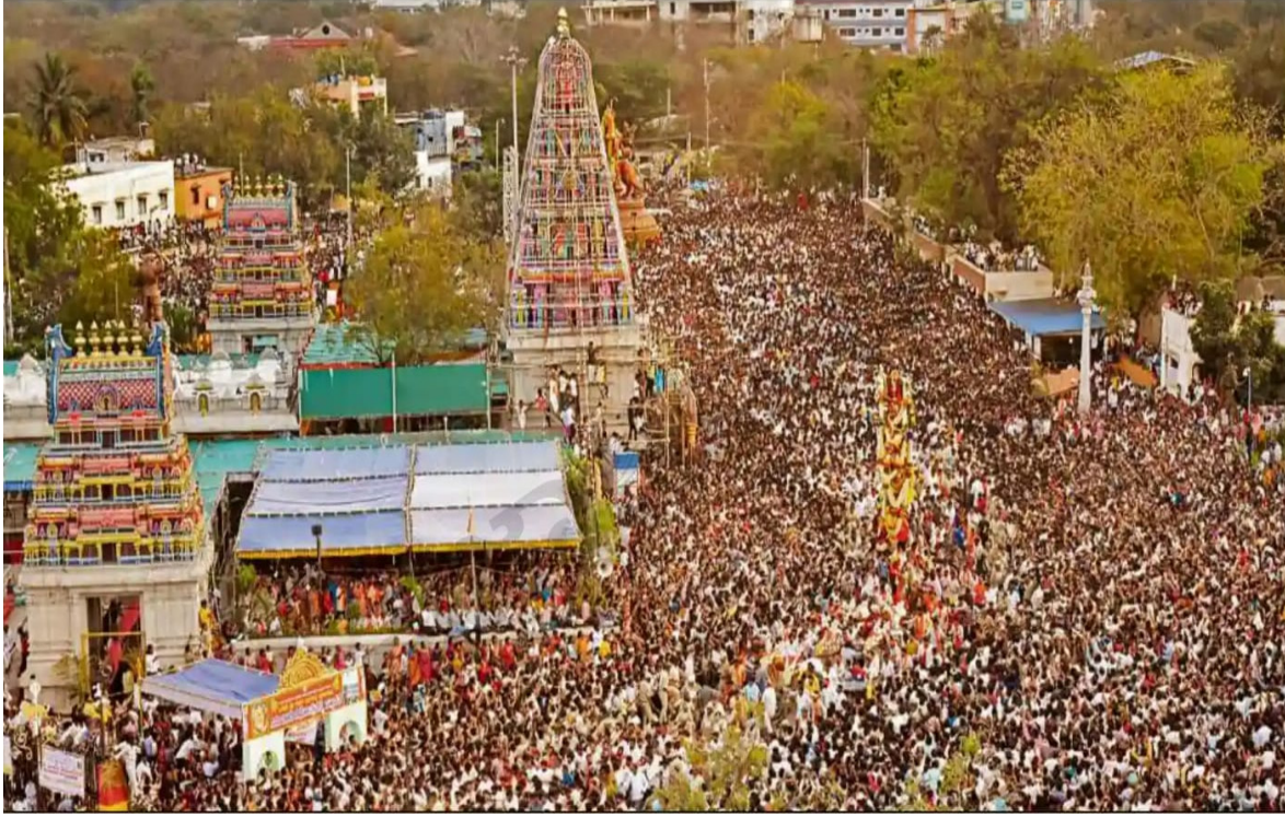
ಬಳ್ಳಾರಿ ನಗರದ ಅಧಿದೇವತೆ ಕನಕದುರ್ಗಮ್ಮ ದೇವಿಯ ಸಿಡಿಬಂಡಿ ರಥೋತ್ಸವ ಇತ್ತೀಚೆಗೆ ಸಾವಿರಾರು ಭಕ್ತರ ಜಯಘೋಷಗಳ ನಡುವೆ ವಿಜೃಂಭಣೆಯಿಂದ ನೆರವೇರಿತು.