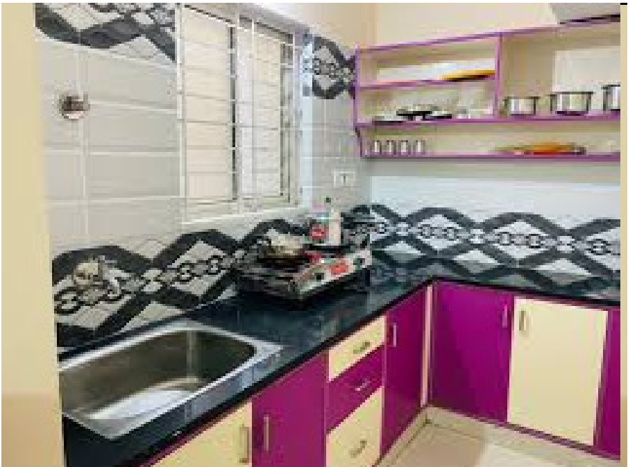
ನವದೆಹಲಿ (ಪಿಟಿಐ): ದೇಶದ ಎಂಟು ಪ್ರಮುಖ ನಗರಗಳ ಪೈಕಿ ಬೆಂಗಳೂರಿನಲ್ಲಿ ಮನೆಗಳ ಬೆಲೆಯು ಕಳೆದ ವರ್ಷ ಶೇ. 13ರಷ್ಟು ಏರಿಕೆಯಾಗಿದೆ. ಇದು ದೇಶದ ಎಂಟು ನಗರಗಳ ಪೈಕಿ ಮನೆಗಳ ಬೆಲೆಯಲ್ಲಿನ ಗರಿಷ್ಠ ಪ್ರಮಾಣದ ಹೆಚ್ಚಳ ಎಂದು ರಿಯಲ್ ಎಸ್ಟೇಟ್ ಸಲಹಾ ಸಂಸ್ಥೆ

ಪ್ರಾಪ್ ಟೈಗರ್ ಹೇಳಿದೆ. 2024ರಲ್ಲಿ ಈ ಎಂಟು ನಗರಗಳಲ್ಲಿ ಮನೆಗಳ ಸರಾಸರಿ ಬೆಲೆಯು ಶೇ 17ರಷ್ಟು ಹೆಚ್ಚಳವಾಗಿದ್ದರೆ, ಕಳೆದ ವರ್ಷ ಶೇ 6ರಷ್ಟು ಏರಿಕೆಯಾಗಿದೆ. ಚೆನ್ನೈನಲ್ಲಿ ಮನೆಗಳ ಬೆಲೆಯಲ್ಲಿ ಯಥಾಸ್ಥಿತಿ ಯಲ್ಲಿದ್ದು, ಪ್ರತಿ ಚದರ ಅಡಿ ದರ ರೂ.7,200 ಇದೆ.